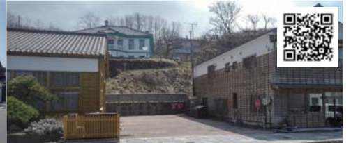
② 江差町会所横駐車場 旧中村家に一番近い場所です