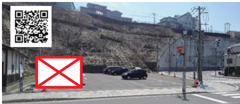
⑥ 佐々木病院前駐車場 お借りしているのは右側のみです