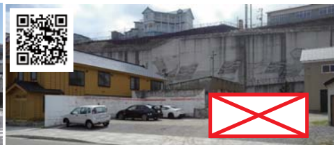
⑦ 旧三洋石油事務所前A 駐車は白い壁前だけ約5台分です