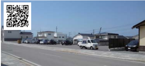
③ 北洋銀行お客様用駐車場