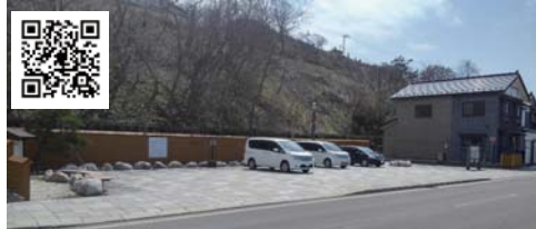
① 東別院下広場 いにしえ街道の北端です

各駐車場の写真と概ねの目印です。 写真上のQRコードを読み込むと、駐車場の位置が表示されます。 大型車対応は⑩のみです。