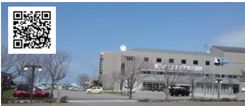
⑨ 江差町役場駐車場 建物の裏側にも駐車スペースあります