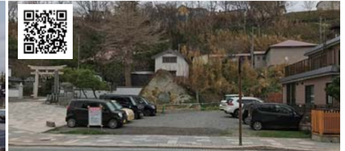
⑤ 江差町臨時駐車場