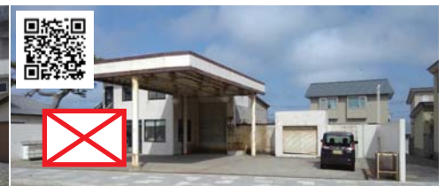
⑧ 旧三洋石油事務所前B 駐車は右側白い壁と柱の間だけです